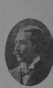
GRAL. EMILIANO CHAMORRO