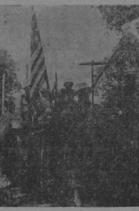
TROPAS AMERICANAS EN NICARAGUA